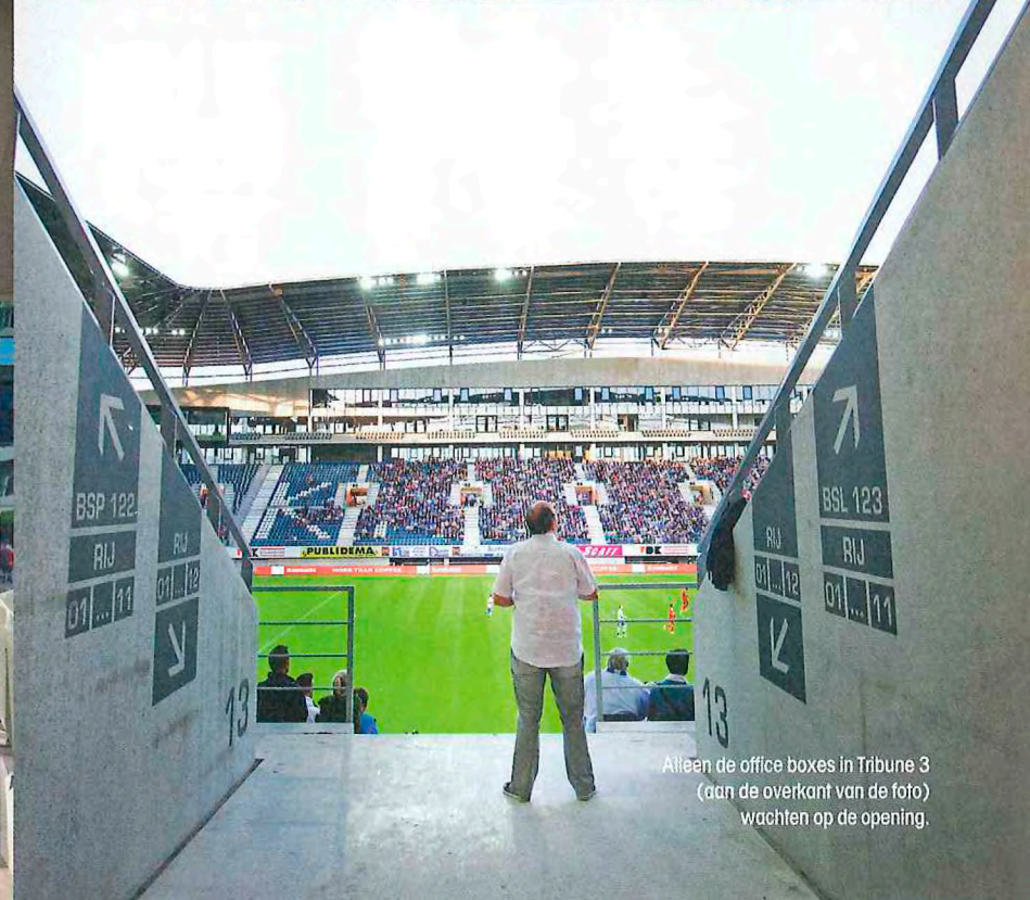
Aileen de office boxes in Tribune 3 (aan de overkant van de foto) wachten op de opening.