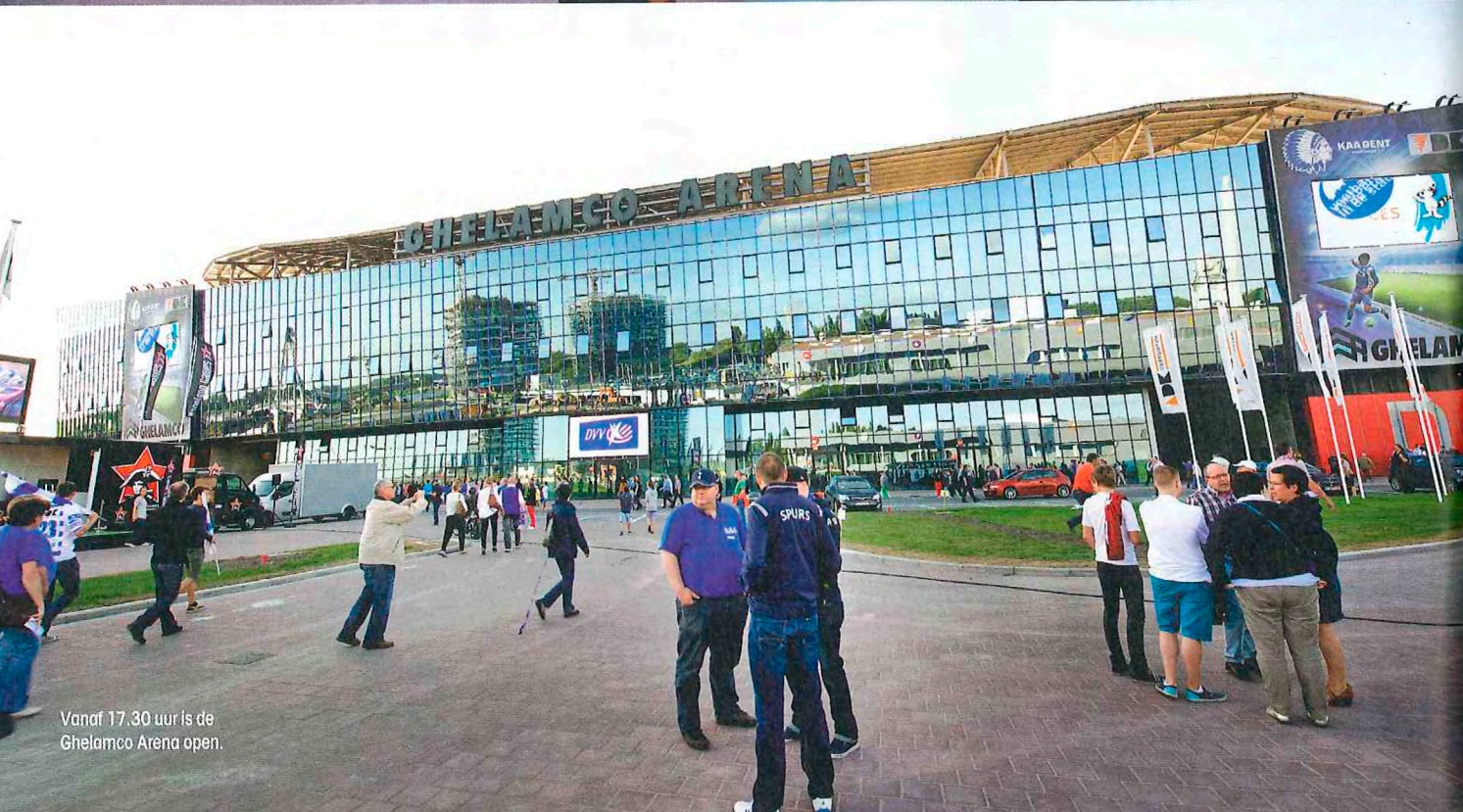
Vanaf 17.30 uur is de Ghelamco Arena open.