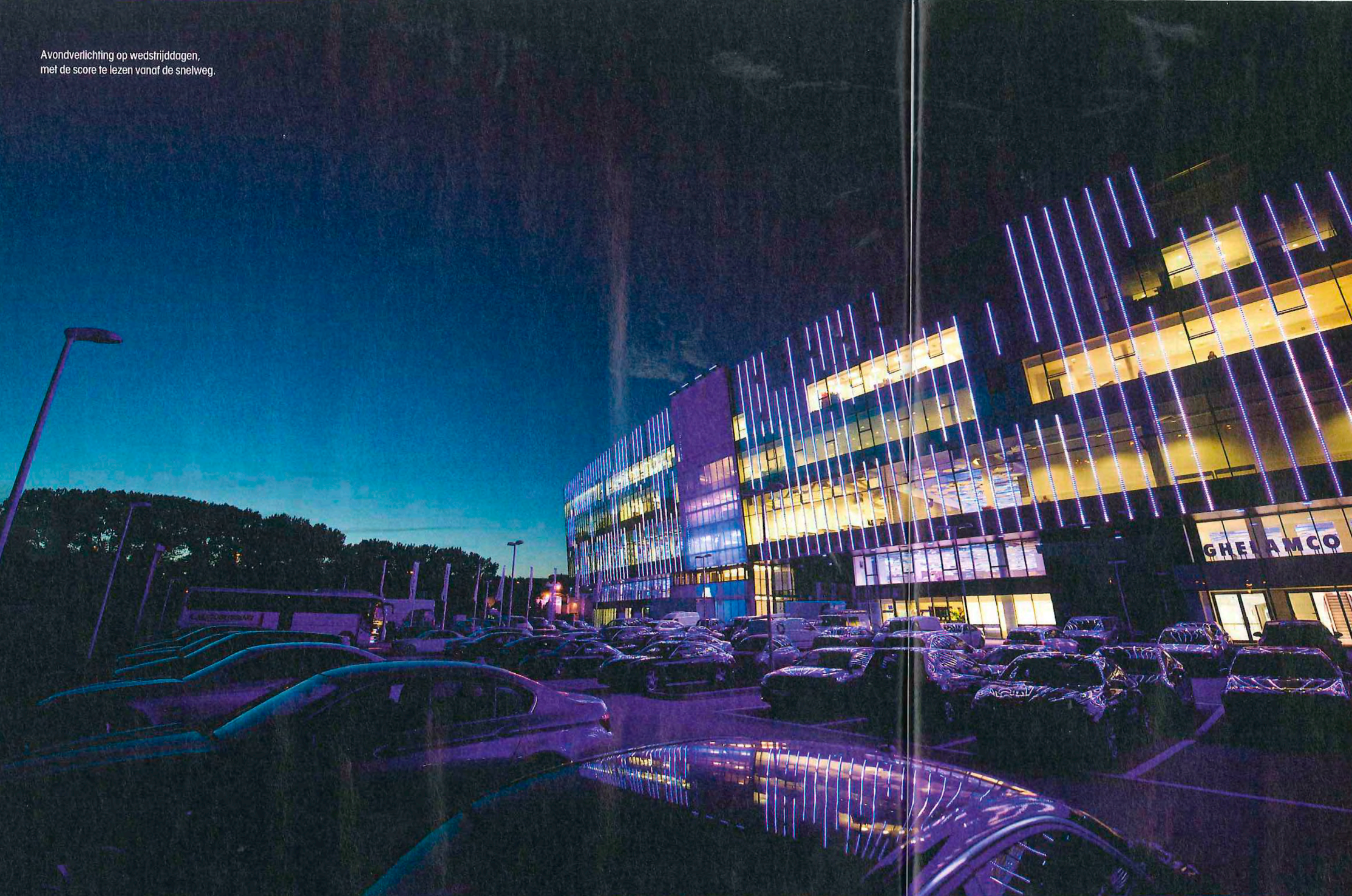
Avondverlichting op wedstrijddagen, met de score te lezen vanaf de snelweg.