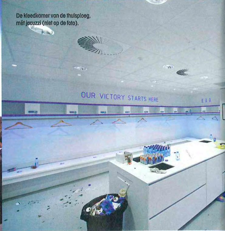
De kleedkamer van de thuisploeg, mét jacuzzi (niet op de foto).