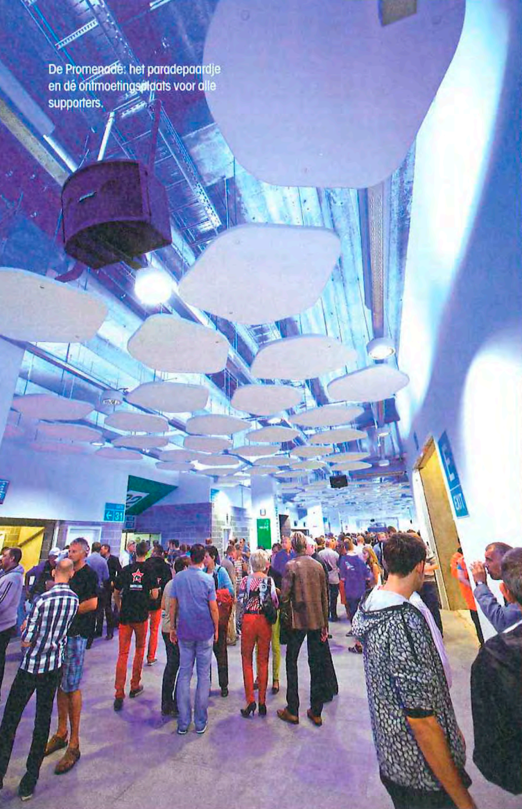
De Promenade: het paradepaardje en de ontmoetingsplaats voor alle supporters.