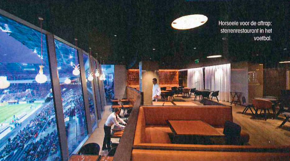
Horseeie voor de aftrap: sterrenrestaurant in het voetbal.