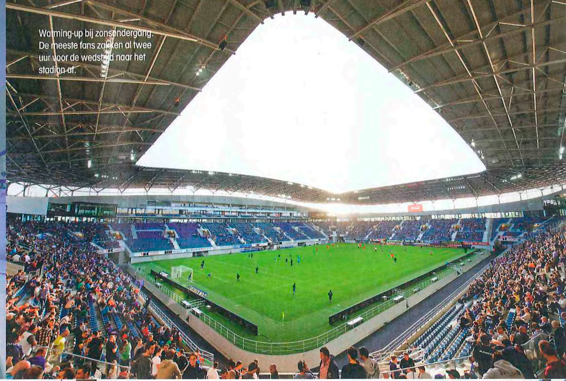
Warming-up bij zonsopgang. De meeste fans zakken al twee uur voor de wedstrijd naar het stadion af.