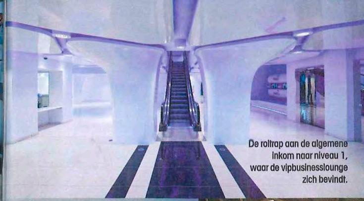
De roltrap aan de algemene Inkom naar niveau 1, waar de vipbusinesslounge zich bevindt.