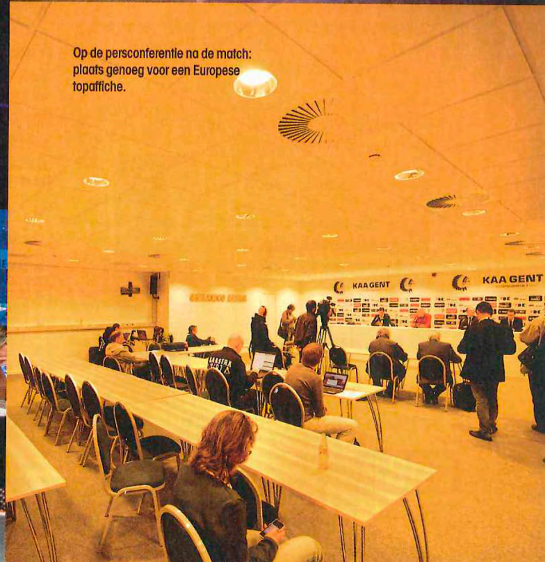
Op de persconferentie na de match: plaats genoeg voor een Europese topafiche.