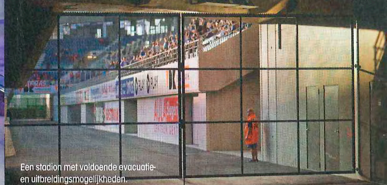
Een stadion met voldoende evacuatie- en uitbreidingsmogelijkheden.